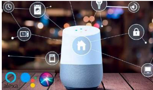
Gambar 25 Asisten Virtual.

Sekarang: Ada pergeseran menuju kolaborasi manusia-mesin, di mana AI dan otomatisasi bekerja bersama manusia untuk meningkatkan produktivitas dan efisiensi. Contohnya termasuk asisten virtual, robotika canggih, dan alat bantu keputusan berbasis AI.