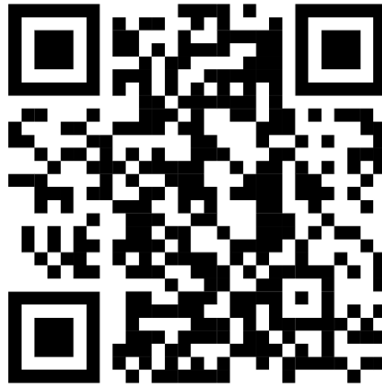
Gambar 19 Code Video Amazon Go