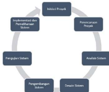
Gambar 14 Tahapan System Development Life Cycle (SDLC).

Siklus hidup proyek sistem informasi menggambarkan tahapan-tahapan yang sistematis dalam merencanakan, mengembangkan, dan menerapkan sebuah sistem informasi. Tahapan ini, yang sering disebut sebagai System Development Life Cycle (SDLC), memastikan bahwa proyek tersebut berjalan dengan terorganisir, dari tahap inisiasi hingga pemeliharaan. SDLC membantu meminimalisir risiko kegagalan dengan memberikan pendekatan bertahap yang bisa dievaluasi di setiap fase. (Prifti & Dhoska, 2022).